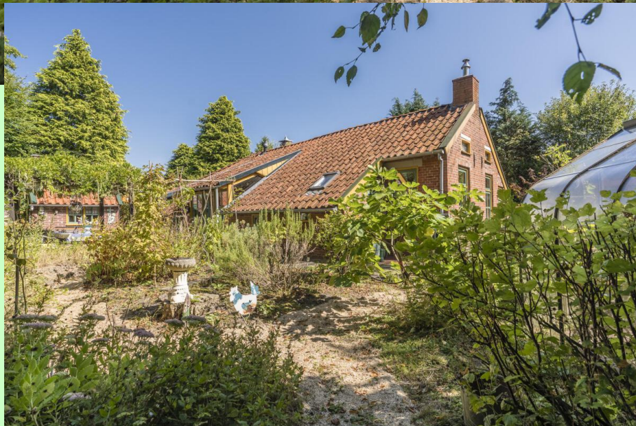
Middensingel 9 te Bellingwolde