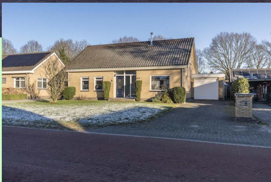
Noorderstraat 5 te Bellingwolde